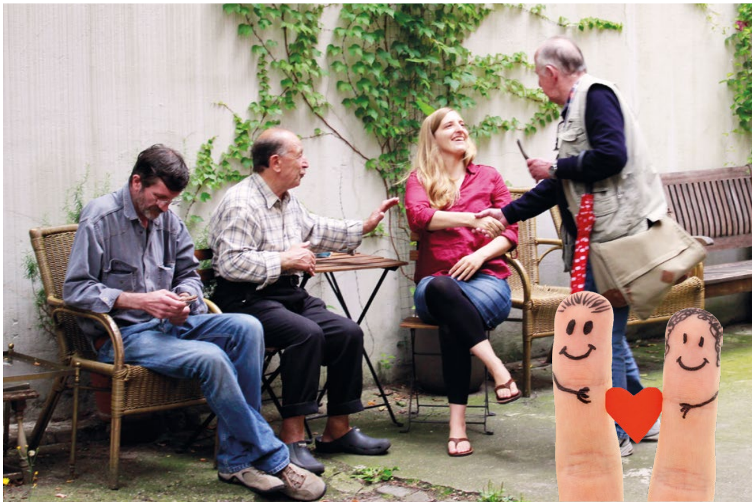
Jeden Donnerstag treffen sich Ehrenamtliche und Nachbarn zum „Schmiedenachmittag“